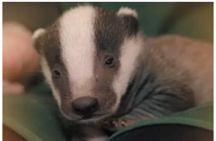
LE BLAIREAU - LA BLAIRELLE - LE BLAIREAUTIN