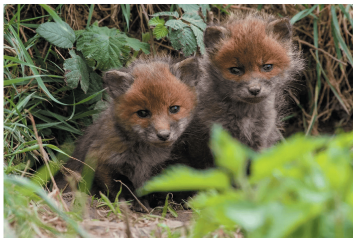
LE RENARD - LA RENARDE - LE RENARDEAU