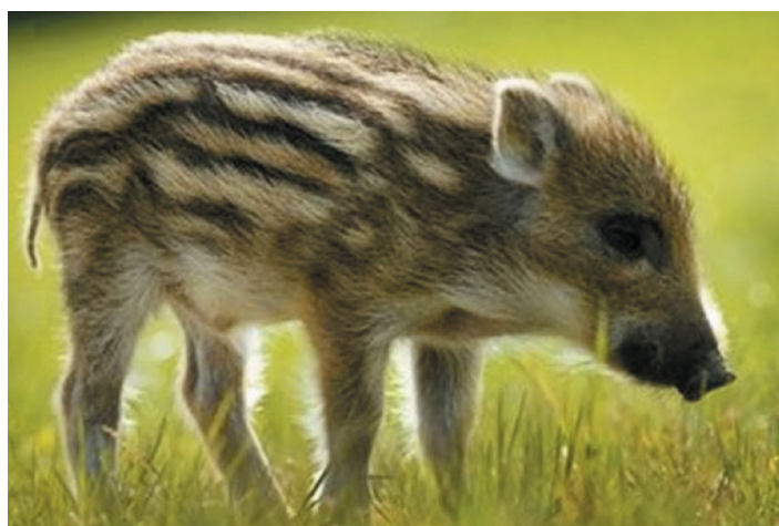
LE SANGlier - LA LAIE - LE MARCASSIN